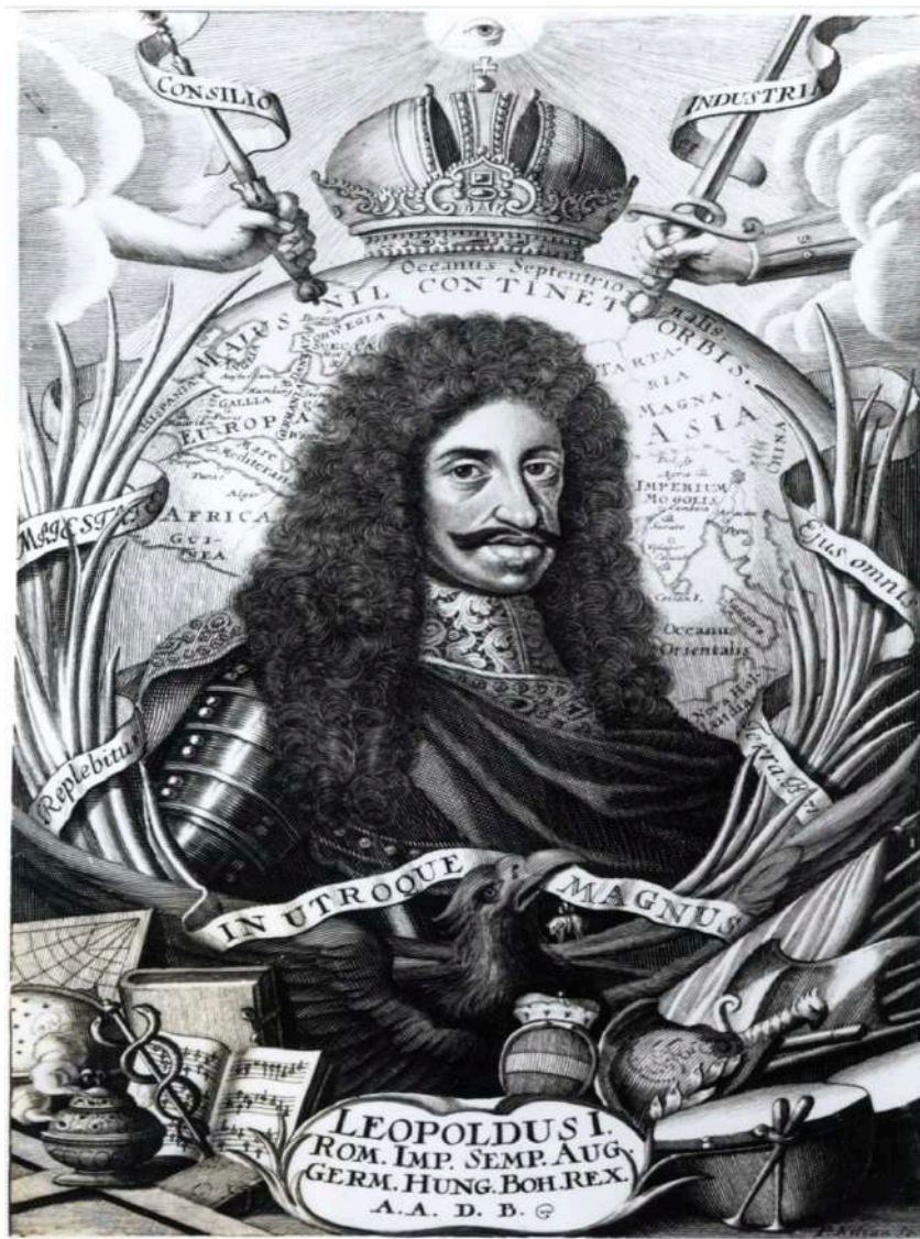
Incisione che ritrae l'Imperatore Leopoldo I - opus: Philipp Kilian.

come un vero e proprio magnete giuridico, intercettando la linea cognatica. In questo modo, le figlie o le nipote venivano investite dell'asse ereditario, trasferendo al genero del disponente o al primogenito della discendenza femminile l'obbligo tassativo di operare la Wappen- und Namensvereinigung , ovvero l'unione dei nomi e delle armi. Il successore per via materna univa i due cognomi e inseriva le armi della casata materna nei quarti nobili dello scudo tramite l'arma inquartata, il Geviertes Wappen , offrendo una testimonianza visiva immediata della successione utriusque sexus . Questa combinazione tra diploma sovrano e disposizione testamentaria evitava l'estinzione storica della famiglia, permettendo al rango imperiale di rigenerarsi all'interno di una nuova intelaiatura onomastica e preservando intatta la memoria collettiva della stirpe. Ma la primogenitura non era comunque tassativamente contemplata nei fidecommessi, talvolta si aprivano, come già esplicitato, più fronti di successione.