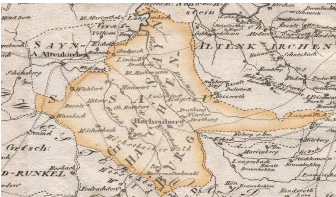
Mappa delle Contee di Sayn (1805).